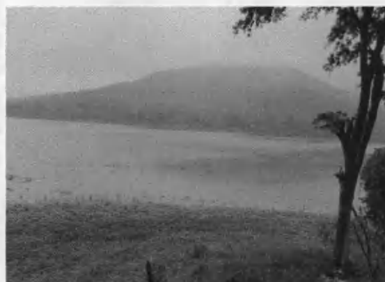
Volcán Las Víboras

El área protegida El Volcán Las Víboras, se identifica con el código SIGAP 50 y categoría de manejo como: Zona de Veda, declarada en el año 1956. El volcán Las Víboras está ubicado en los municipios de Atescatempa y Asunción Mita del Departamento de Jutiapa y se encuentra localizada entre las coordenadas Lat. 14° 12' 49" N y Long. 89° 43' 33" O además al pie de este importante volcán se localiza la laguna de Atescatempa, principal cuerpo de agua del municipio.