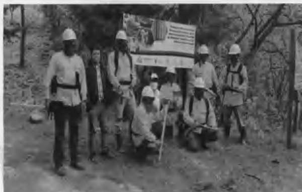
Cuadrilla de bomberos forestales Oficina Territorial Guatemala 2021

Dentro de las actividades estratégicas que comprende el proyecto está la capacitación y equipamiento de los bomberos forestales, que fueron beneficiados con equipo para su protección en caso de incendios dentro de la reserva de Biosfera, se consolidó y fortaleció una cuadrilla con personal del proyecto y de la finca Las Coronillas, quien estará a cargo de las actividades de prevención y control de incendios forestales en el área del proyecto y sus alrededores.