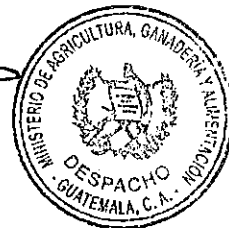
Ing. Maynor Estuardo Estrada Rosales MINISTRO DE AGRICULTURA, GANADERÍA Y ALIMENTACIÓN

SEGUNDO. La presente resolución empieza a regir a partir de la presente fecha; notifíquese.