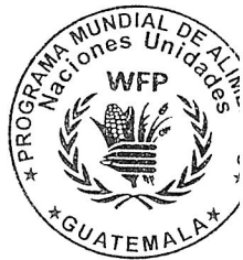
TANIA FRANCOIS M. GOOSSENS REPRESENTANTE PROGRAMA MUNDIAL DE ALIMENTOS DE LAS NACIONES UNIDAS