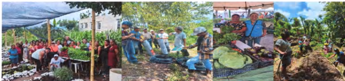
Sabana Grande, Chiquimula