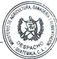
Ing. Maynor Estuardo Estrada Rosales MINISTRO DE AGRICULTURA, GANADERÍA Y ALIMENTACIÓN